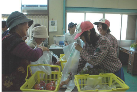
● ふれあいマートの開設、生産物の提供