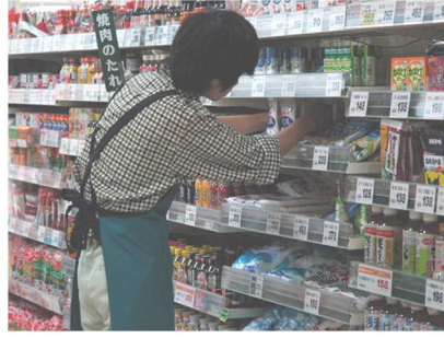
● コープマートでの職場体験実習