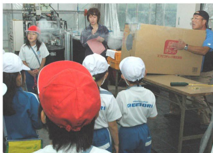
● 小学校への食育指導