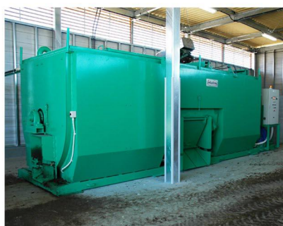
● リサイクルプラント