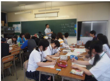
● 大学教授による講義