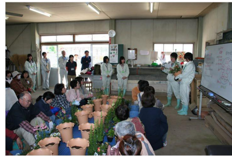
● 花のまちガーデニング教室