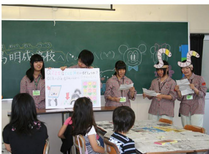
● 子供向けガーデニング教室