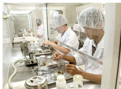
● 遺伝子組換えの実験