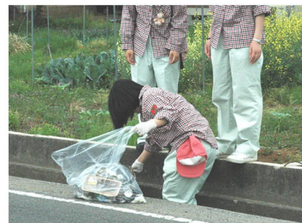
● 学校周辺のゴミ拾い