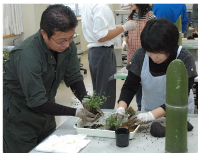
● ワークショップ明成「植栽アート」