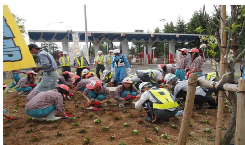
● 福島西インター前の花壇整備