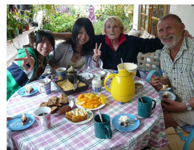
● 海外研修「ファームステイ」