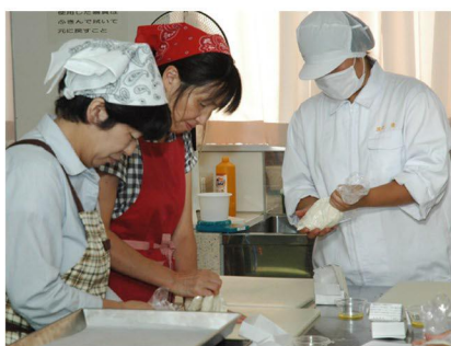
● ワークショップ明成「パン製造」