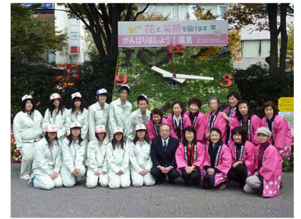
● 福島商工会議所女性会との連携事業「福島駅花時計」