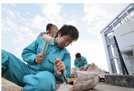
● 流木を利用した実習風景