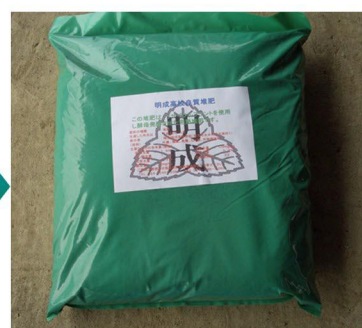
● リサイクルプラント堆肥商品