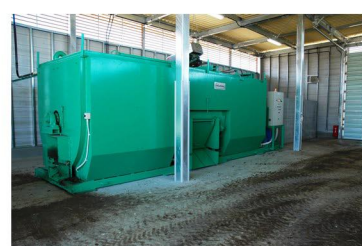
● リサイクルプラント