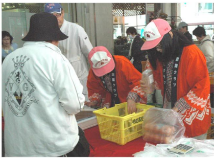
● 市内デパート連携事業「朝市」