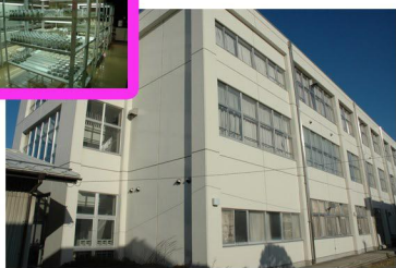
● 実験棟「食品・バイオ・情報」