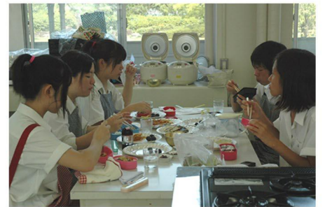
● 地元農産物でお弁当の調理