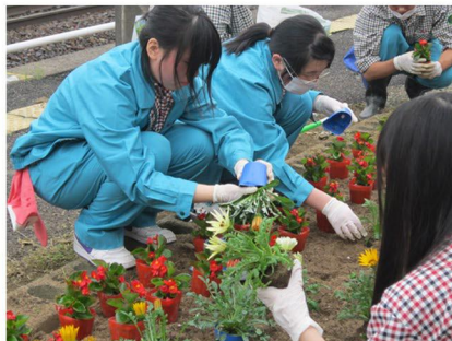
● 駅構内の花壇整備