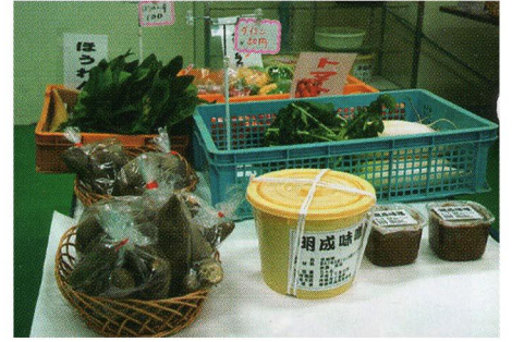
● 保存料を使用しない食品製造